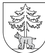
Герб города сегодня