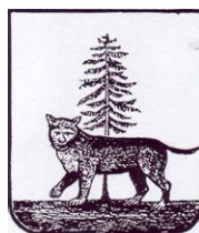
Герб города в 1846 году